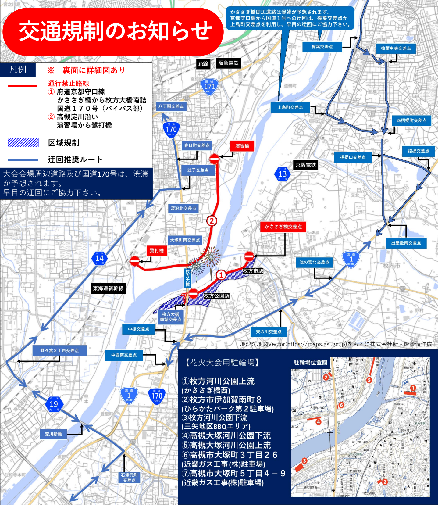
地理院地図Vector(https://maps.gsi.go.jp)をもとに株式会社新大阪警備作成

かささぎ橋周辺道路は混雑が予想されます。京都守口線から国道1号への迂回は、樟葉交差点か上島町交差点を利用し、早目の迂回にご協力下さい。